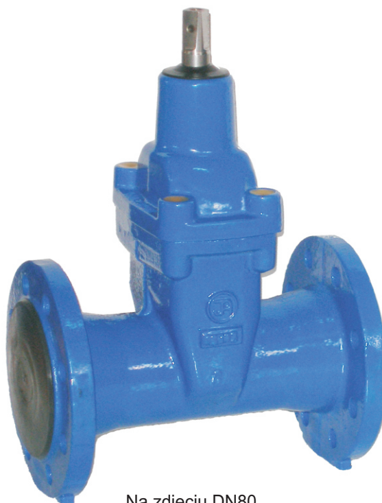
Na zdjęciu DN80