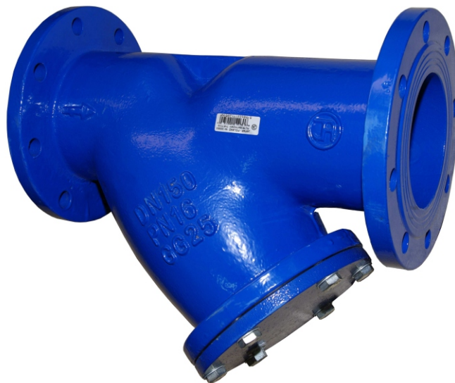
Na zdjęciu DN150